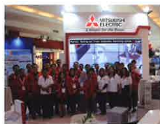
出展ブース (インドネシア)

今後も更なる伸長が期待されるインドネシア市場において三菱CNCを安心してお使いいただけるように、サービスサポートを更に強化してまいります。