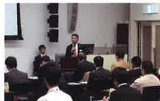
三菱CNC新機能紹介セミナー

また、三菱CNCグローバルサービス事業の紹介とMMEG修理棟などのご視察により、「いつでも どこでも いつまでも」をスローガンとした当社サービス理念と充実したサービス体制に対して高い評価をいただきました。