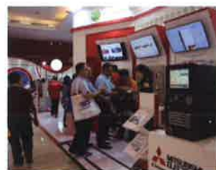
三菱CNC展示コーナー