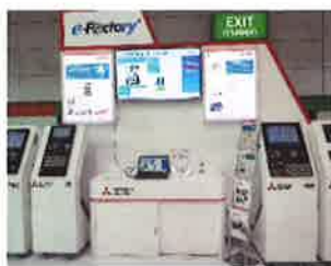
稼働監視展示コーナー