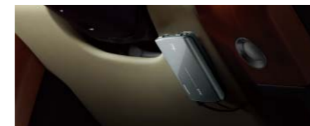
ハンドルの下部に