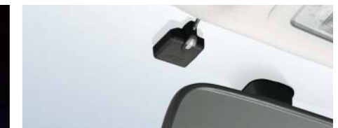
ルームミラー裏のフロントガラスに *アンテナ部をフロントガラスに取付ける際は、ルームミラーの陰で運転者の視界の妨げにならない場所に取付けてください。