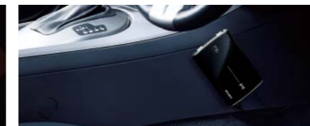
運転席/助手席まわりの目立たない所に