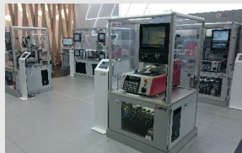
加工ソリューション展示

・5軸加工や複合加工などのソリューション毎にM800/M80/C80シリーズの最新機能を紹介