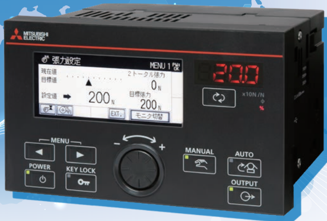
テンションコントローラ LE7-40GU-L

CEマーキング, KCマーク対応により、海外で使用している設備のリニューアルなどがしやすくなりました。