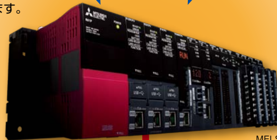
MELSEC IQ-Rシリーズ MELSEC-Qシリーズ