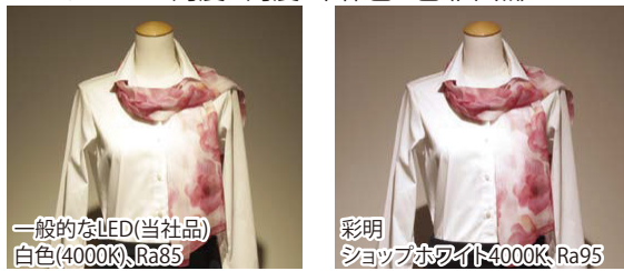
一般的なLED(当社品) 白色(4000K) Ra85

白を引き立て、色の深みを表示する光。 1/2ビーム角度 4角度・本体色 2色(白・黒)