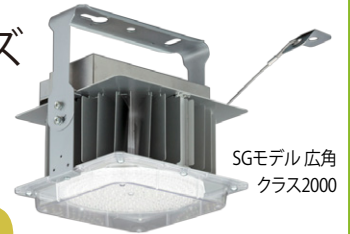
SGモデル 広角 クラス2000

クラス5000(水銀ランプ700形×2器具相当)も登場・寿命60,000時間、豊富なラインアップの高機能SGモデル 200.5lm/Wの高効率で段調光機能など三菱独自のこだわり機能を搭載したHGモデル 手頃な価格設定で汎用性の高いRGモデルの3モデルを発売します。