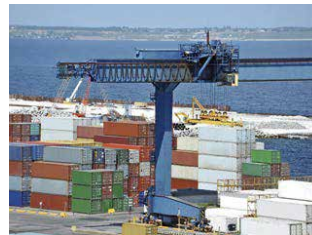
湾岸エリアの物流拠点の カーゴコンテナなど