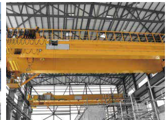
湾岸エリアに隣接する大型組立工場