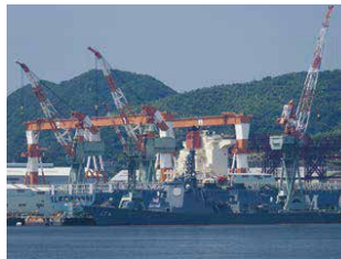
湾岸クレーンを使用する造船所