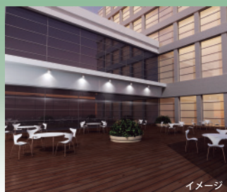
様々な施設の屋外照明