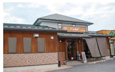
県道68号線沿いに建つ一軒家レストラン

全国屈指の賑わいを見せた旧中山道大井宿。その大井宿跡にほど近い恵那市内に、2022年7月、「チェルベア」様がオープン。窯焼きピッツァや本格的イタリアンのほか、和食を加えたコースもあり、女性グループから若者、家族連れまで、幅広いお客様から支持されています。同年12月には、県の補助金を利用して換気設備の改修と増設を行い、店内環境はさらに快適に。温湿度やCO 2 濃度に応じた換気扇運転をIoTで実現し、電気代も削減できました。