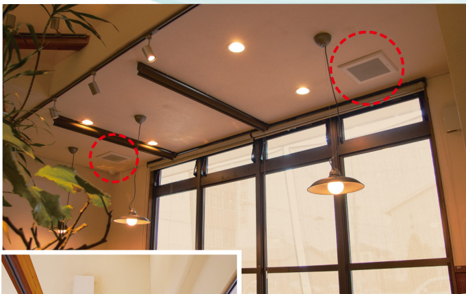
テーブル席 (4人掛け×3卓) にダクト用換気扇DCタイプを2台採用