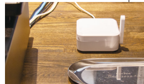
温湿度とCO 2 濃度を計測し、伝送する環境センサーはレジ脇に