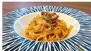
看板メニューの一つ、恵那鶏のポロネーゼ。三日かけて仕込むラグーが味の決め手