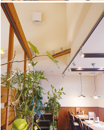
メインルームのテーブル席は下がり天井。アトリウム側はバーカウンターがある