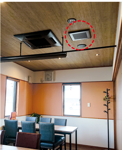
開店時に新たに設けた個室。こちらのダクト用換気扇(ACタイプ)も今回更新した