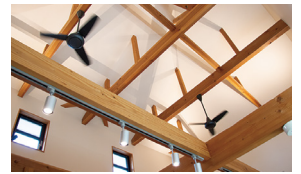
アトリウムの天井扇