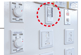
スマートスイッチは厨房の壁面に。隣のロータリースイッチは天井扇用