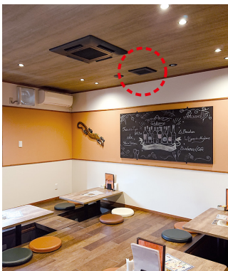
小上がり席のダクト用換気扇(ACタイプ)も更新。三菱電機製の空調機も好評

IoT換気扇システムは、環境センサーと連動した自動制御により、お客様の人数に応じて効率よく換気できる点がいいですね。入り切りの手間がかからないので運営面でも助かりますし、密対策としてはもちろん、節電にも有効です。定休日変更に伴うスケジュール運転の更新も、スマホに入れたアプリ(MyMU)で簡単にできました。スマホで店内の空気質が「見える」点も安心です。当店の小上がり席や個室、系列店(恵那の「ぜんや」、中津川の「Dan・厨」)では三菱電機の空調機を使っており、三菱電機製品の良さを実感しているので、IoT換気システムも期待をもって導入することができました。