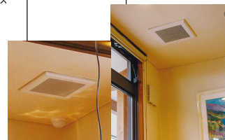
1台は更新、もう1台は増設。いずれもDCタイプ