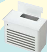
●ヒータースタンド(床置き) JP-310HS 2 -W(ホワイト) 標準価格 48,300円 小売価格 (税別) 46,000円