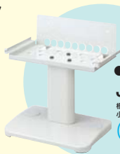
●ジェットタオルスタンド JP-23FS-W(ホワイト) 標準価格 21,000円 小売価格 (税別) 20,000円