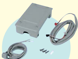
●ジェットタオル自動ドア連動回路ボックス JP-100RD 標準価格 21,000円 (税別) 20,000円