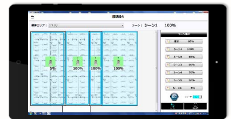
※専用操作アプリ タブレット画面イメージ

札幌市が所有する札幌コンベンションセンターは、札幌市の環境方針である「環境首都・札幌」に則って環境問題に取り組んでいます。大ホールの天井照明は、メタルハライドランプ300形器具が設置されていましたが、消費電力量が多く、さらにこまめな点灯・消灯ができないことから運用に課題がありました。この度導入されたLED高天井用ベースライト「GTシリーズ」角タイプは無線調光システム「MILCO.S」[ワイヤレスタイプ]と組み合わせることで、使用目的やエリアに合わせて手元のタブレットで調光が可能。管理室やホール内など作業者の状況に合わせて設定が行えるようになりました。消費電力量の大幅削減に加え、ホールの使用形態の多様化に対応すると共に「LED照明」の導入は、環境問題への積極的な取組を広くアピールすることにつながっています。