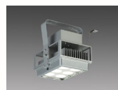
LED高天井用照明 「GTシリーズ」産業用 重耐塩/耐油煙・高温 クラス2000 (メタルハライドランプ 400形 器具相当)