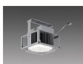
LED高天井用照明 「GTシリーズ」産業用 軒下 クラス1500 (水銀ランプ 400形器具相当)