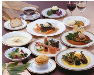
▲甲州牛をはじめとする地産の食材で作られたフレンチを提供