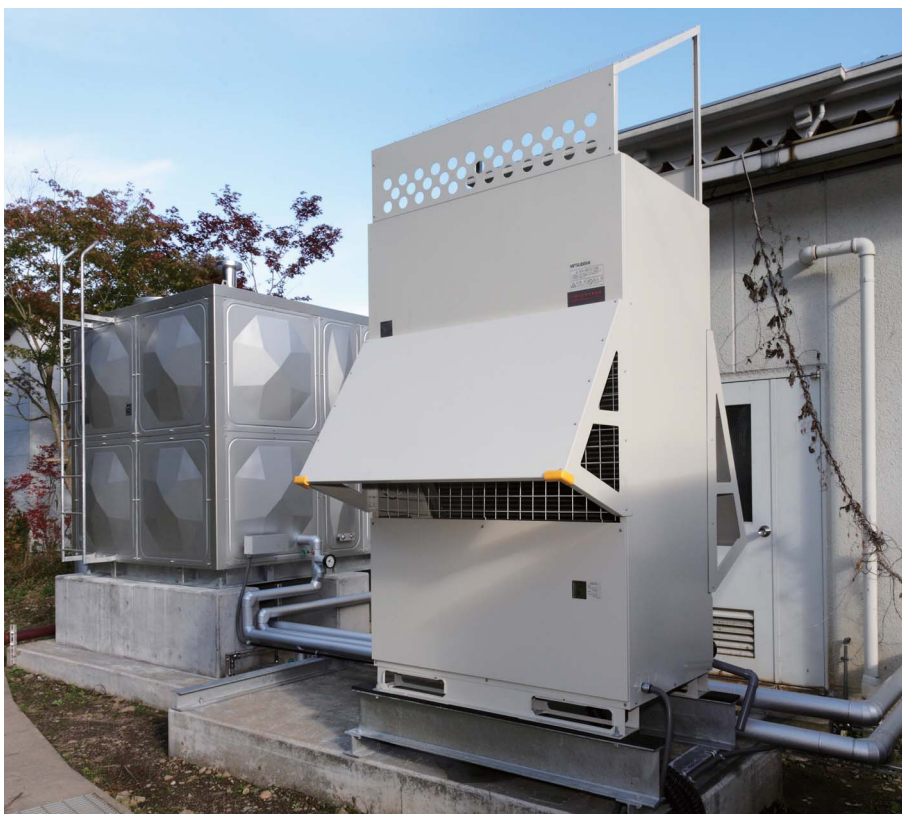
▲エコキュートには防雪フードを取り付けた

環境負荷低減とランニングコスト削減という二大目的に適う機種として選定されたのは、三菱電機の業務用エコキュート。2008年9月の更新後は、エコキュートの夜間稼働のみで、大浴場・客室の風呂・調理室(食器洗浄用)などメインである東館全ての給湯を賅っています。この冬、暖房需要が本格化した後もエネルギーコストで好結果が得られれば、西館用としてエコキュートを増設する予定です。