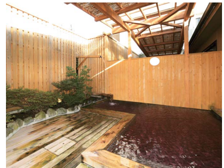
▲大浴場に併設された露天風呂