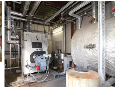
▲更新された重油焚き温水発生機と既設の貯湯槽