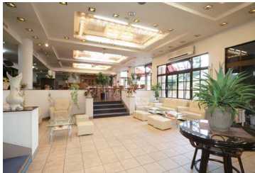
▲明るい光が差し込むラウンジ

導入して1ヶ月経ちますが、電気式ヒートポンプは煙を出さず景観を損なうことがないのでうれしい限りです。ランニングコスト削減については、エネルギー消費量が最も大きくなる冬季に力を発揮してくれると期待しています。この冬の結果が好調であれば、西館へもエコキュートの導入を考えています。