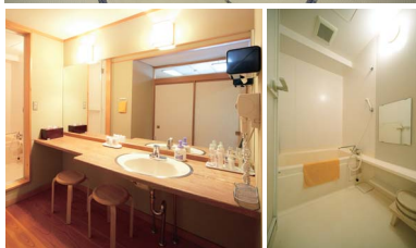
▲各部屋にある広い洗面台とバスタブ