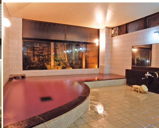
▲大浴場。美肌効果があるというワイン風呂