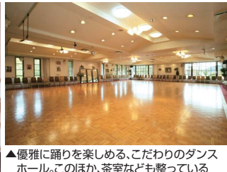
▲優雅に踊りを楽しめる、こだわりのダンスホール。このほか、茶室なども整っている