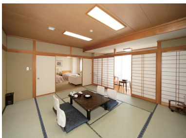
◀ゆったりとくつろげる客室