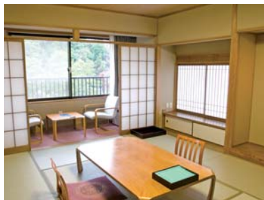
▼落ち着いた雰囲気のある全(室24室)。空調の室内ユニットはビルトイン形