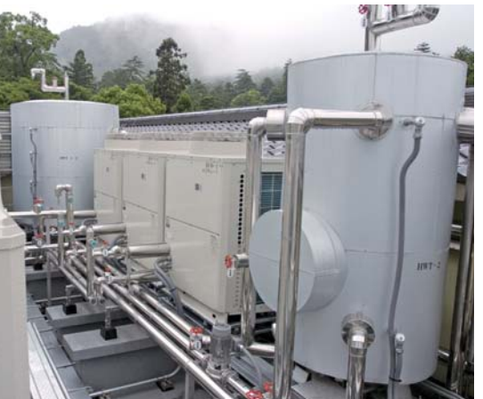
◀ホットウォーターヒートポンプ

▼屋上に設置された業務用エコキュート×3。貯湯槽(左奥)は密閉型の6t×3。更新前は開放型だったが、スペース対応で密閉型が採用された。手前はホットウォーターヒートポンプの加熱昇温用循環槽(1t)