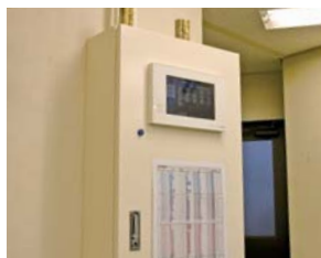
▲事務所内の空調集中コントローラG-150AD。「スイッチ式だった以前に比べ、液晶画面で集中管理できて便利」という声も。給湯管理もできるが今回は異常信号受け取りのみ設定。制御盤にはデマンド監視制御を行うE-Energyも組み込んだ