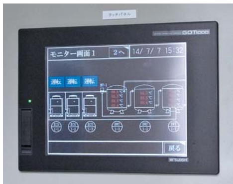
三菱電機のGOTを活用した給湯制御システムはイシバシエンタープライズ様オリジナル。常時監視とデータ取り出しが容易で、異常時も不具合箇所がすぐわかる

更新後の給湯は、重油ボイラー式が多い他のホテルと比べても、システム的にかかなり安定していると思います。毎日湯温を3回チェックしますが、ほぼ一定で、 安心して使えるという実感があります 。修学旅行の生徒さんが大勢泊まる時でも問題ありません。空調に関しては事務所での一括管理が便利で、お客様の声にすぐ応えられるのもいいですね。 給湯・空調併せて、コスト面でも電気式で正解 だと思います。当社のリゾート事業部としては初めての施設運営ですが、今後も設備・管理の効率化と、お客様へのサービス向上を図っていきます。