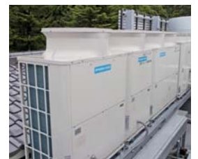
▲シティマルチYGRは12系統採用

世界文化遺産の厳島神社まで徒歩10分以内と、宮島観光に絶好の位置にある「みやじま杜の宿」様。大元神社の森に囲まれた静かな佇まいや、国民宿舎ならではのリーズナブルな料金も人気の宿です。同館は1962年開業の国民宿舎「宮島ロッジ」を前身として、1993年の全館リニューアルを機に現名称に変更。さらに2013年12月からの大規模改修を経て2014年4月にリニューアルオープンしました。