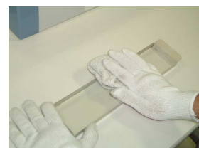
特殊活性炭フィルター BP-200DF