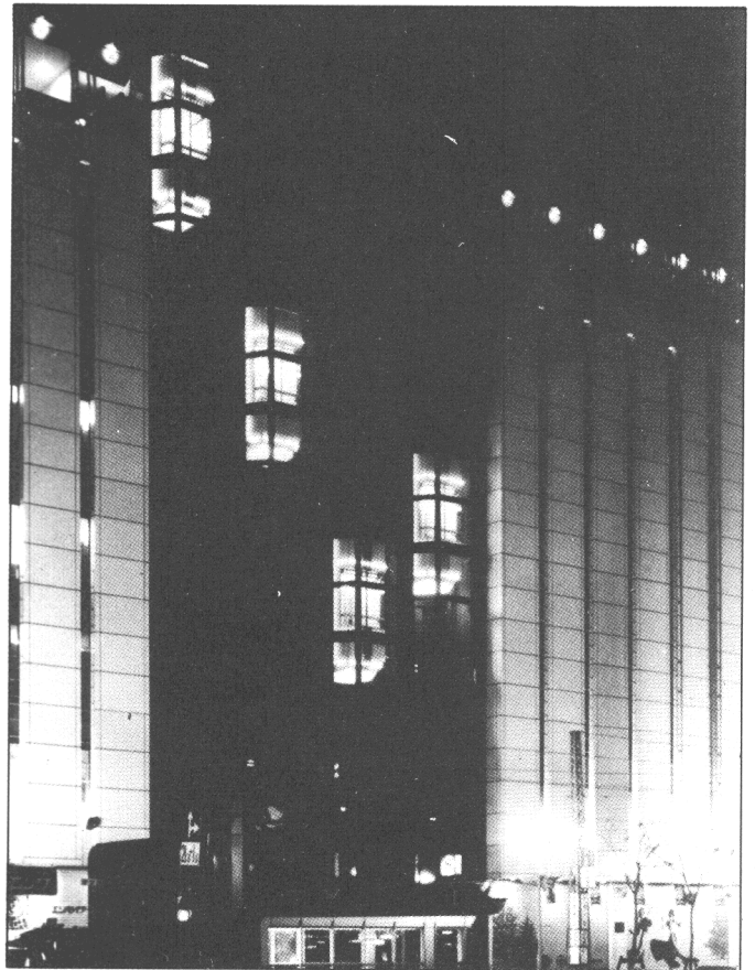
ダイヤフラッシャー実施例(エレベータ下部部分)

その他ご注文により、負荷容量および色の数、周期は変更いただけますのでお問合せください。