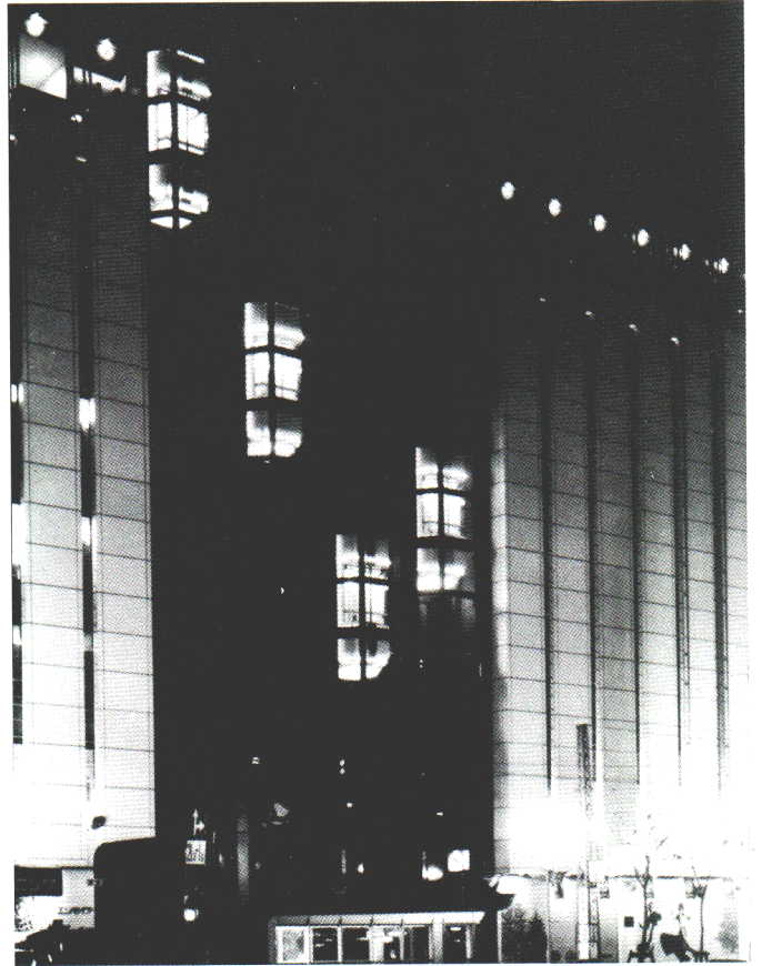
ダイヤフラッシャー実施例(エレベータ下部部分)

その他ご注文により、負荷容量および色の数、周期は変更されますのでお問合せください。