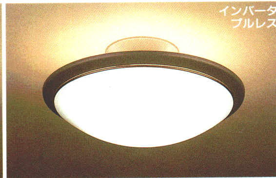
ZML7 ¥57,800 ①