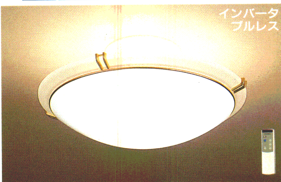
ZM4 ¥58,500 ①