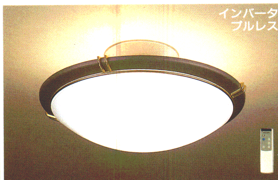
ZM5 ¥62,800 ①