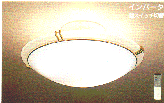
ZM4 特選 ¥58,500 ① ●(32W+40W)形円形ルピカ蛍光灯(エース色)+40W形円形ルピカ蛍光灯(電球色) ●乳白アクリルカバー(帯電防止仕様) ●金色飾り ●リモコン・壁スイッチ切替(全光・直接光・間接光・常夜灯・消灯) ●マイコン搭載 ●2CHリモコンつき ●マニュアルスイッチつき ●外径φ600 全高250 重4.0kg