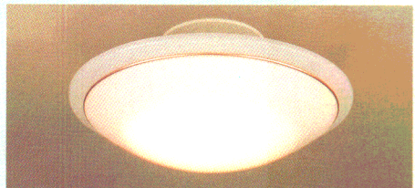
常夜灯 5W豆球 お休みの時の常夜灯です。