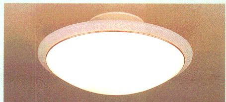
直接照明 (32W+40W)形円形ルピカ蛍光灯(エース色) 明るくクリアな蛍光灯のアかりが部屋全体に広がります。活動的な 日常生活に最適な明るさです。