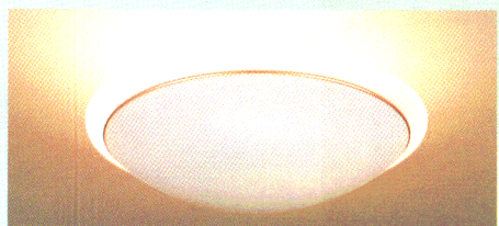
間接照明 40W形円形ルピカ蛍光灯(電球色) あたたかみのある電球色蛍光灯が部屋全体をやわらかい雰囲気でご つみます。テレビやご家族の会話を楽しむ時など、くつろぎのひと ときを演出します。