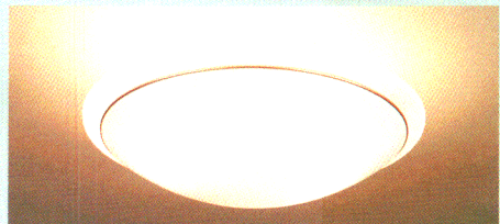
全灯 (32W+40W)形円形ルピカ蛍光灯(エース色) +40W形円形ルピカ蛍光灯(電球色) 直接光と間接光で、部屋全体を明るくライトアップします。ご家族 でのだんらん、パーティなどを華やかに演出します。

●器具全体の高さはわずか25cm。天井にぴったりフィット するので部屋全体が広く見え、インテリア性を損なうこと なく、アかり演出が可能です。