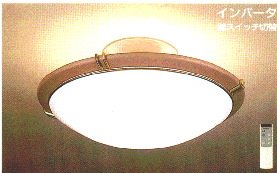
ZM5 特選 ¥62,800 ① ●(32W+40W)形円形ルピカ蛍光灯(エース色)+40W形円形ルピカ蛍光灯(電球色) ●乳白アクリルカバー(帯電防止仕様) ●ダークベージュメタリック塗装仕上/金色飾り ●リモコン・壁スイッチ切替(全光・直接光・間接光・常夜灯・消灯) ●マイコン搭載 ●2CHリモコンつき ●マニュアルスイッチつき ●外径φ600 全高250 重4.0kg