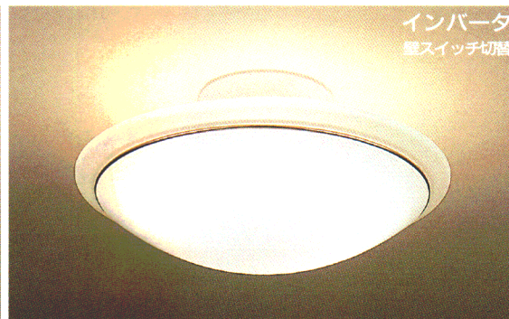
ZML6 ¥53,500 ① ●(32W+40W)形円形ルピカ蛍光灯(エース色)+40W形円形ルピカ蛍光灯(電球色) ●乳白アクリルカバー(帯電防止仕様) ●壁スイッチ切替(全光・直接光・間接光・常夜灯・消灯) ●外径φ600 全高250 重4.0kg