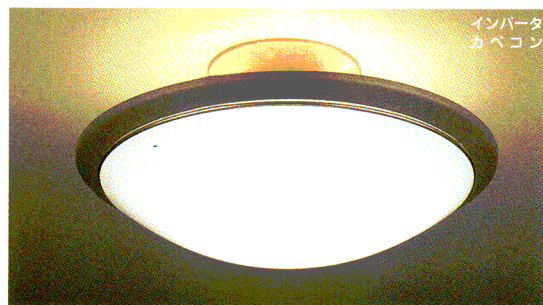
インバータ カベコン