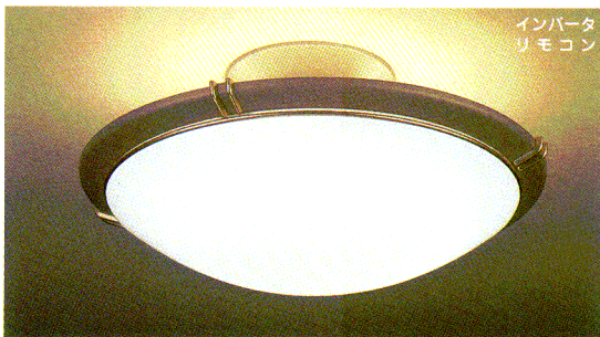
インバータ リモコン