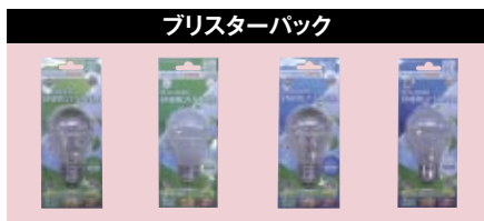
プリスターパック