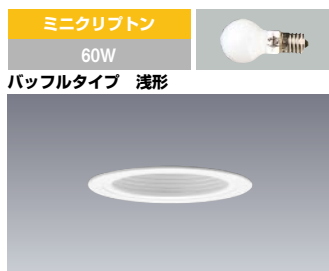
ミニクリプトン 60W パッフルタイプ 浅形