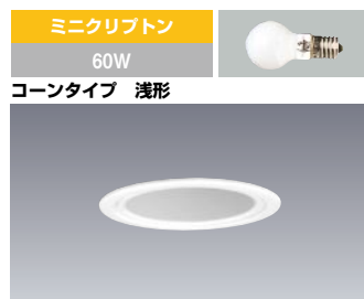
ミニクリプトン 60W コーンタイプ 浅形