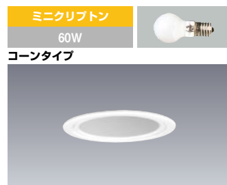
ミニクリプトン 60W コーンタイプ