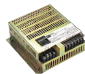
白熱灯調光端末器 (白熱灯1600W用) MS1716