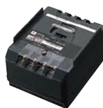
白熱灯調光端末器 (白熱灯800W用) MS1708