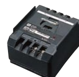
調光信号端末器 (インバータ蛍光灯用) MS1701

▲=受注生産品(ご注文後約3~6週間を要します) 受注=受注生産品(販売会社・販売店にお問い合わせください)