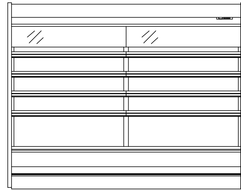
(8R S=1/25) 正面図