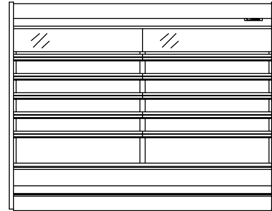
(8R S=1/25) 正面図