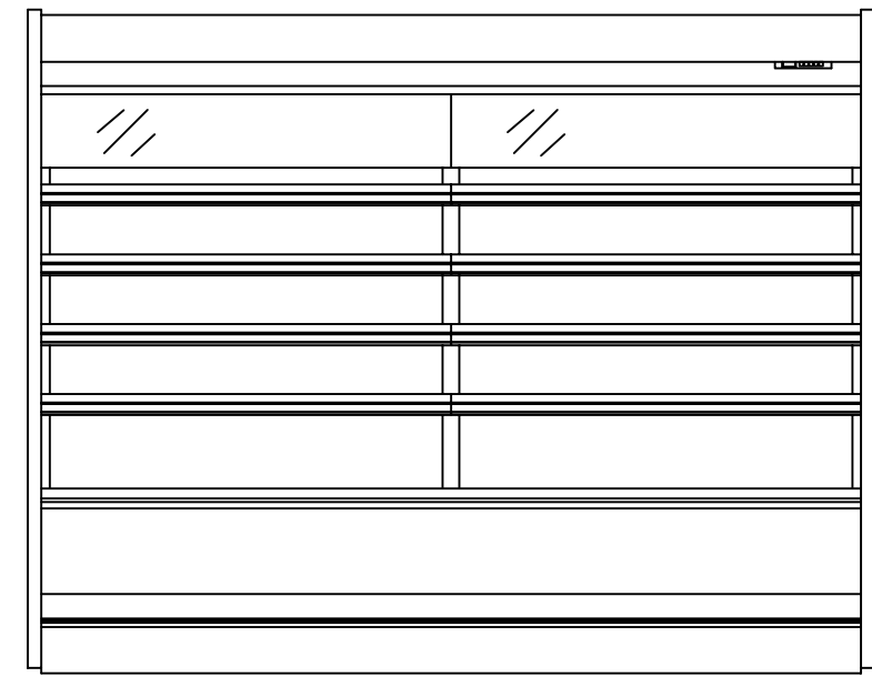
(8R S=1/25) 正面図