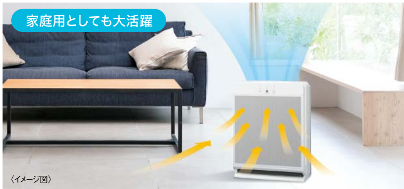
家庭用としても大活躍