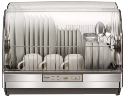
ステンレスグレー(H)